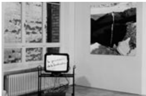
Teerhaufen, 1987, Schwarzweiss-Fotografie/Black-and-white photograph, 120 x 120 cm, Ausstellungsansicht/View of the exhibiton, Galerie Alexander Hodel