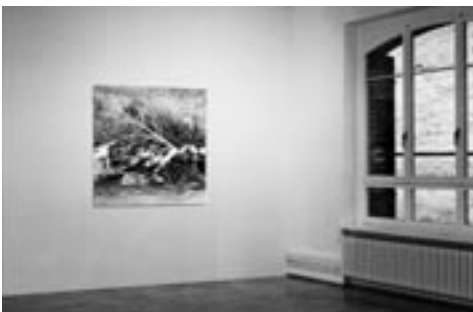
Bäumchen, 1987, Schwarzweiss-Fotografie/Black-and-white photograph, 120 x 120 cm Ausstellungsansicht/View of the exhibiton, Galerie Alexander Hodel