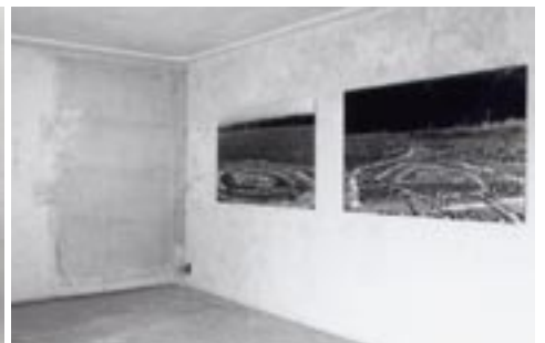
EIS, 1988–1991, links oben /left above: Turnpike Bridge, Miami 1991, Schwarzweiss-Fotokopie (8-teilig) /Black-and-white photocopy, (8 parts) 105×29.7 cm, rechts oben /right above: Exit Palmetto, Miami 1991, Schwarzweiss-Fotokopie, (4-teilig) /Black-and-white photocopy, (4 parts) 105×29.7 cm, Ausstellungsansicht /View of the exhibition, U-Galerie unten /below: Ausstellungsansicht /view of the exhibition, Stellmacherhaus 1991